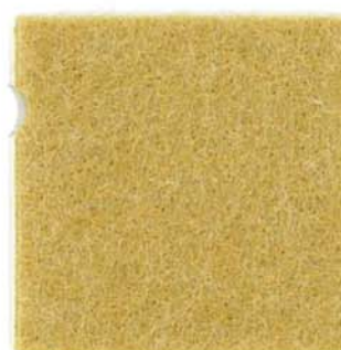
M-30 サフラン saffron