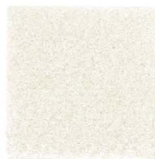
M-20 バニラ vanilla