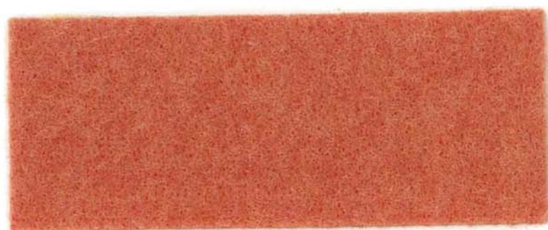
M-31 アプリコット apricot