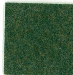
M-40 リーフグリーン leaf green