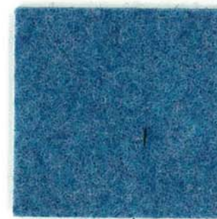
M-50 エーゲブルー aegean blue