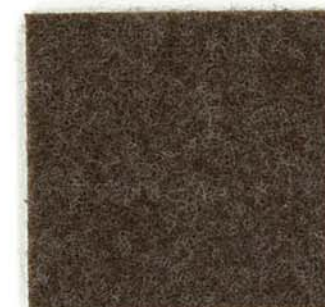
M-22 カカオ cacao