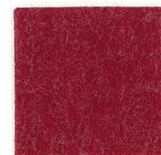
M-11 チェリーレッド cherry red