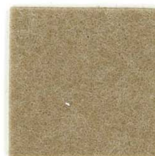
M-21 ヘンプ hemp