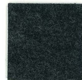
M-79 チャコール charcoal